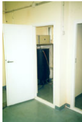
Vista esterna del sistema di Disinfezione dell'Acqua Enviolyte