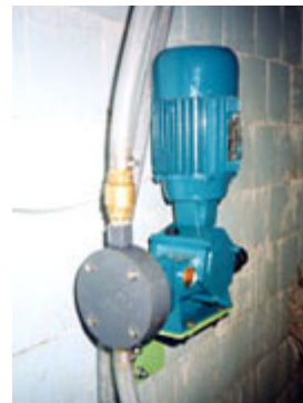
Pompaggio dell'Anolyte Nella tubatura